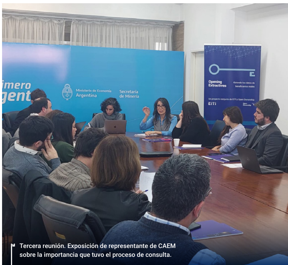
Terceira reunión. Exposición de representante de CAEM sobre la importancia que tuvo el proceso de consulta.

Si bien la declaración de beneficiarios finales será un requisito obligatorio, la divulgación de dicha información será voluntaria, por lo que el sujeto obligado podrá manifestar expresamente su voluntad de que los datos sean públicos para que cualquier persona pueda consultarlos