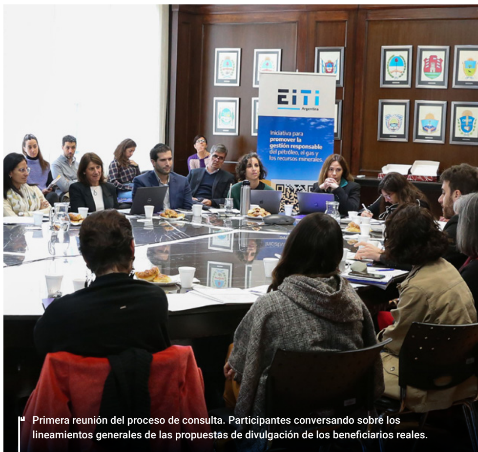
Primera reunión del proceso de consulta. Participantes conversando sobre los lineamientos generales de las propuestas de divulgación de los beneficiarios reales.

Finalizado el primer encuentro, se invitó a las personas interesadas a participar del proceso de presentación de comentarios sobre las propuestas formuladas tanto por la Secretaría de Minería como de la Secretaría de Energía. Ya que la divulgación de los datos sobre beneficiarios finales en el sector extractivo podía presentarse a partir de la modificación de normas emanadas de los propios organismos públicos involucrados, y en línea con las propuestas elaboradas en el estudio de alcance antes mencionado, se presentaron propuestas separadas, pero unificadas en un mismo documento, ya que su implementación dependería de cada Secretaría, cada una dentro del ámbito de sus propias competencias.