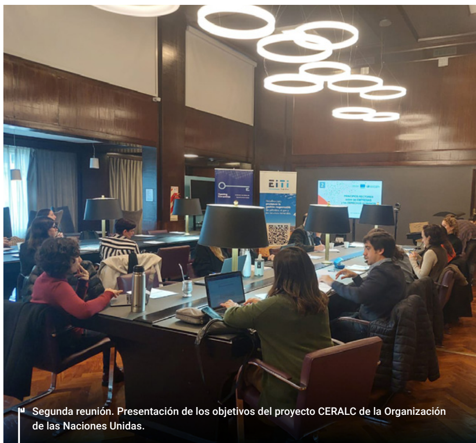
Segunda reunión. Presentación de los objetivos del proyecto CERALC de la Organización de las Naciones Unidas.